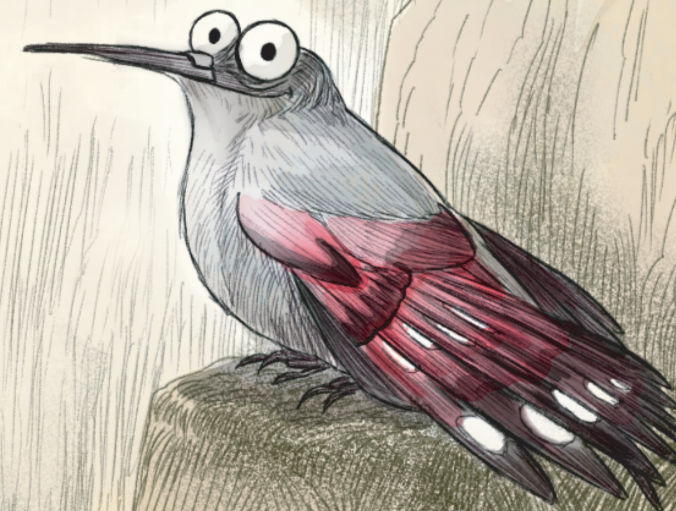
FIG 2. TICHODROMA MURARIA