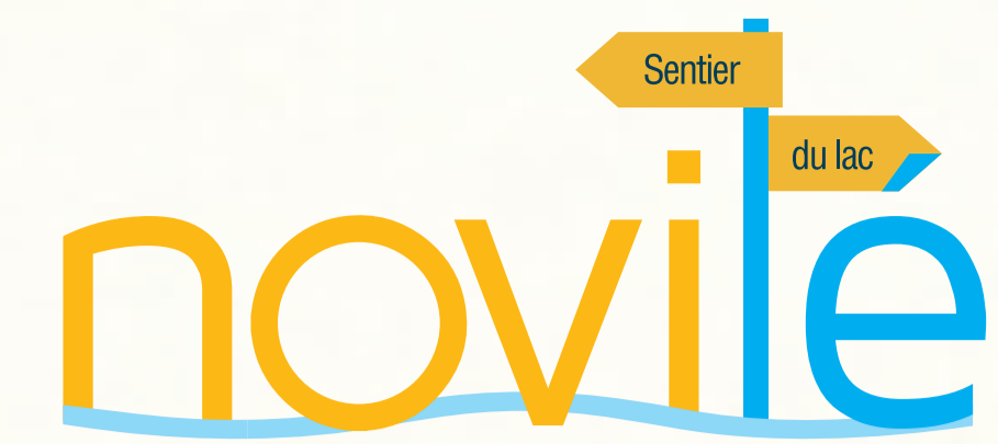
Illustration : DNA Studios concept global : dep-art.ch