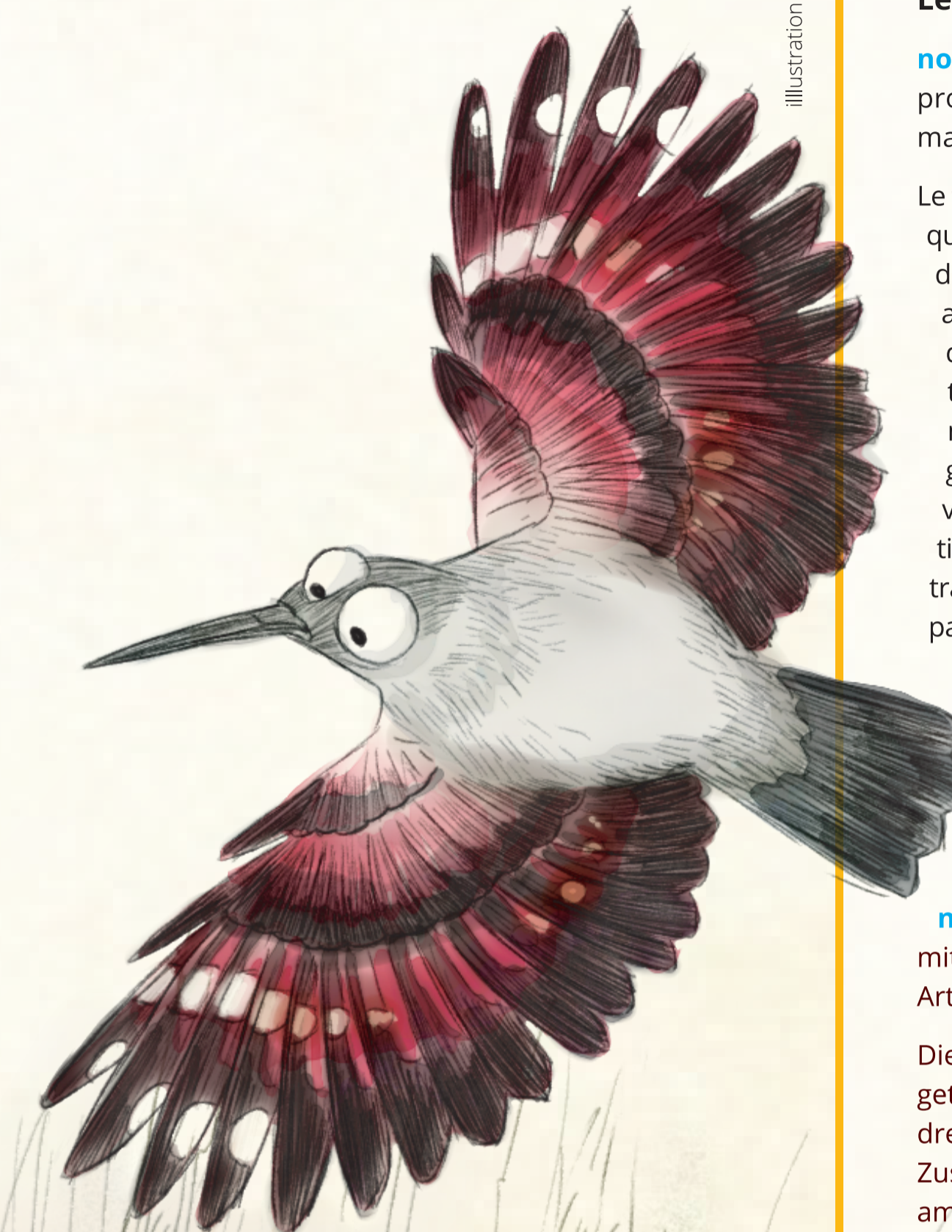
Le vol du Tichodrome

Illustration : DNA Studios concept global : dep-art.ch